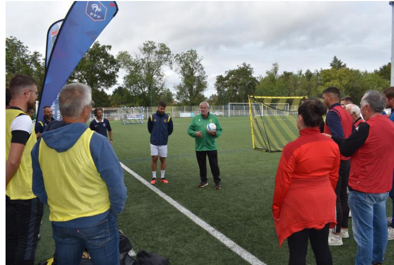
Rassemblement FFF « Clubs Lieu de Vie » en septembre à Bouaye (44).