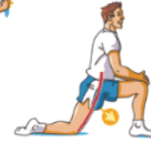
Quadriceps et Psoas